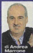
di Andrea Marrone

In libreria Una storia coinvolgente e attuale, nel nuovo romanzo di Silvia Bonucci