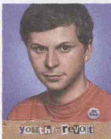
"Youth In Revolt"

Non tutti i film arrivano in sala. Anzi, solo una piccolissima parte di ciò che viene prodotto viene distribuito. Questa la situazione in Italia: 25mila i titoli che "nascono" nel mondo, 500 quelli che arrivano al cinema. Quali sono i criteri che guidano i