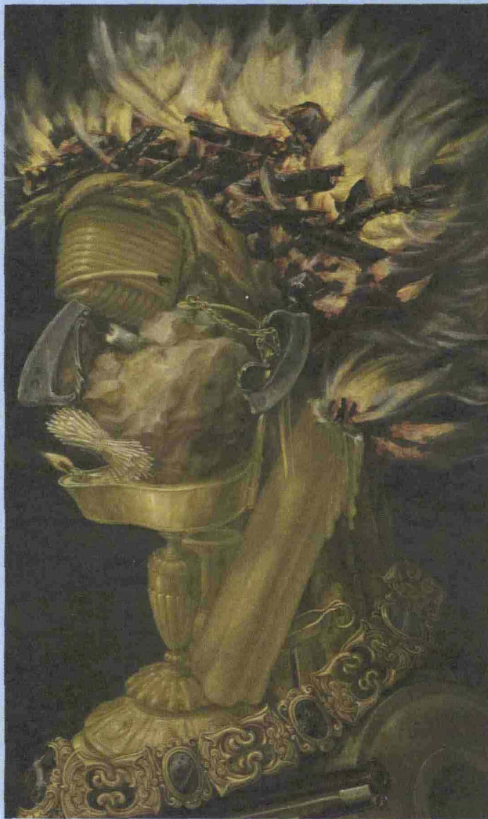
"Il Fuoco", 1566, in arrivo dal Kunsthistorisches Museum di Vienna

È entrato nella leggenda dell'arte con i suoi trionfi di frutta e verdura, cascate di mele e peperoni rossi orchestrati sulla tela a formare volti di nobili titolati, dame con gli occhi a forma di gamberetto, cavalieri con elmi di melanzane e cortigiani con gorgiere di asparagi ed erbe. Arcimboldo, il pittore del Cinquecento milanese, s'era inventato un genere in bilico fra la ritrattistica e la natura morta. Cosa per cui è diventato famoso ma che ha contribuito a consegnarlo alla storia come un grande caricaturista, anche se, in realtà, la sua vicenda è ben più complessa. Lo rivela la mostra a Palazzo Reale (inaugurazione: mercoledì 9 ore 18. Fino al 22 maggio. Info 0292800375. Euro 9/7,50), prodotta dal Comune e Skira, in collaborazione con il Kunsthistorisches di Vienna da cui arrivano molte opere esposte. Capolavori suoi e di autori che ne intrecciarono la storia, utili a restituire il clima di un'epoca segnata dall'industria del lusso nelle più ricche corti d'Europa. (c.g.)